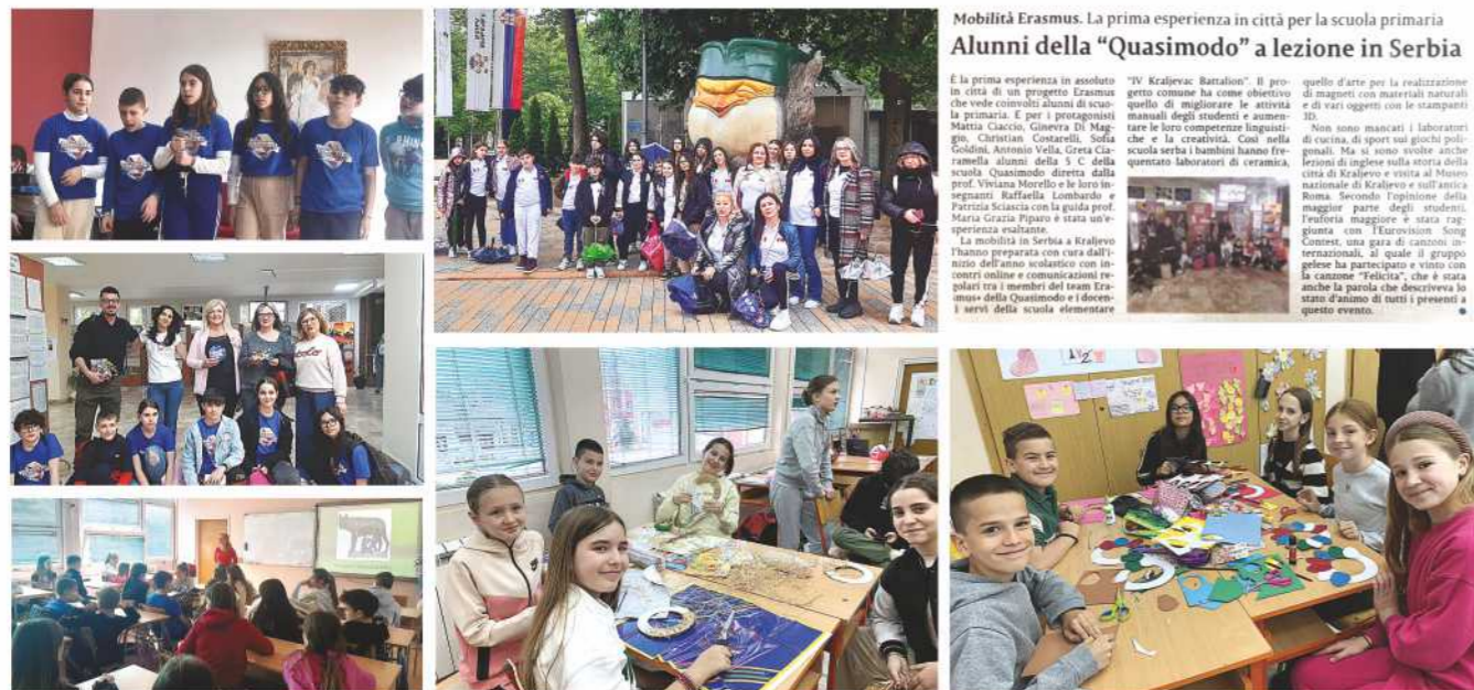
Mobilità Erasmus. La prima esperienza in città per la scuola primaria Alunni della "Quasimodo" a lezione in Serbia

ОСНОВНЕ ШКОЛЕ ICS „S. QUASIMODO“ GELA SA СИЦИЛИЈЕ, ИТАЛИЈА 15-22. 4. 2024. ГОДИНЕ