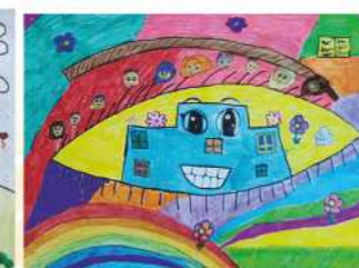
Дуња Јанковић, III, 3. награда