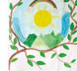
Андријана Васиљевић VII, 2. награда