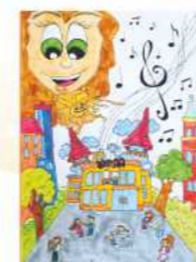
Катарина Радосављевић, IV, 1. награда