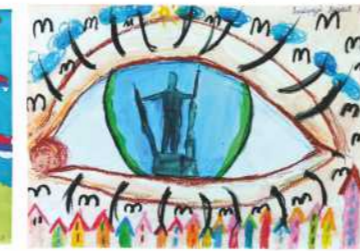
Викторија Вранић I, 3. награда