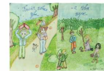
Ана Милићевић VI, 2. награда