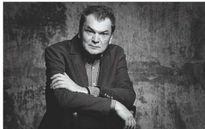
Ип меморијам Горан Петровић, књижевник и академик