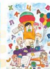
Софија Новаковић, VII, 2. награда