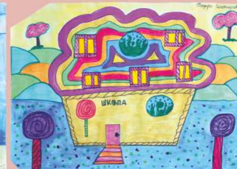
Теодора Станишић IV, 2. награда млађи