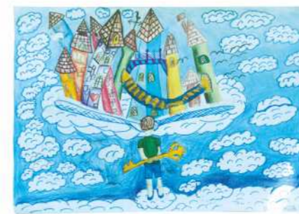
Филип Крстић VI, друга награда