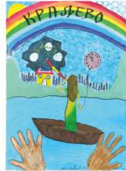
Јана Милетић VII, 2. награда

Уживали смо у лепотама града виђеним очима деце на радовима који су били изложени у холу школе.