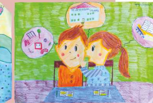
Софија Добричић II, 3. награда млађи