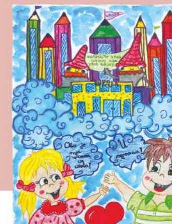
Катарина Радосављевић V, 3. награда старији