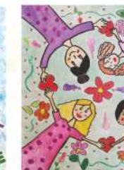
Сара Тешић, VII, 3. награда