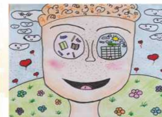
Антонина Јанковић, IV, 2. награда