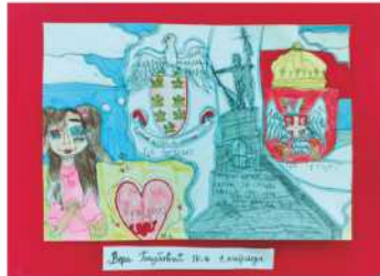
Вера Голубовић IV, 1. награда