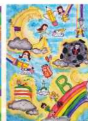
Невена Здравковић, V, 1. награда