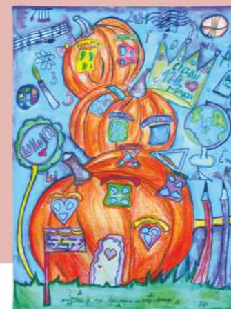
Нађа Дошић, 1. награда старији